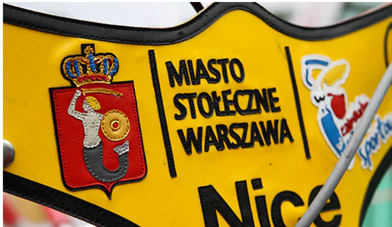
/ Na zdjęciu: osłona kierownicy motocykla żużlowego